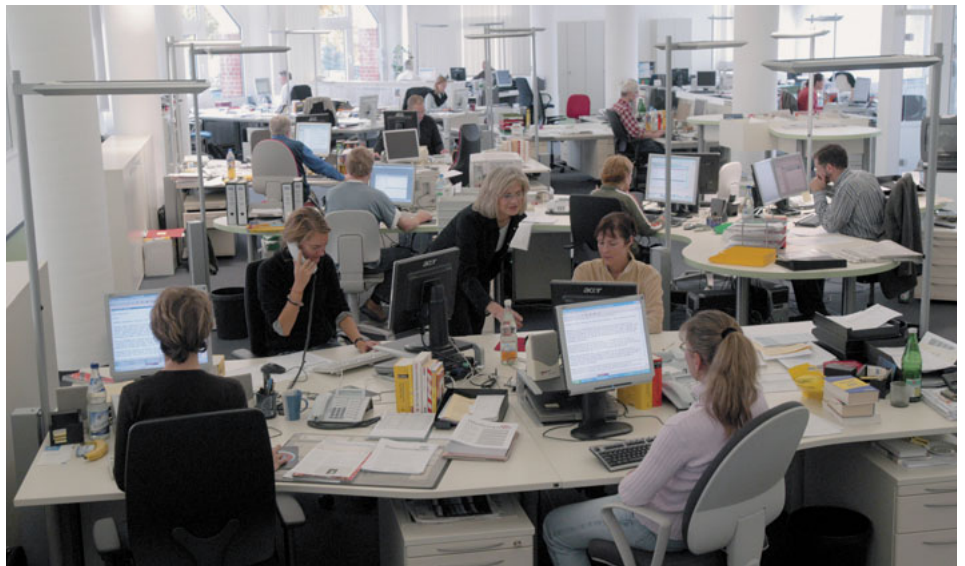
Der epd-Newsroom im Gemeinschaftswerk