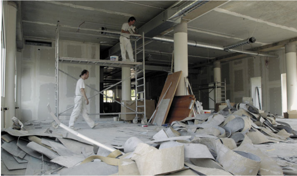
April 2004: Die Räumlichkeiten der ehemaligen Hausdruckerei werden entkernt.