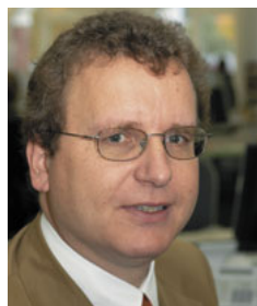
Thomas Schiller Fotos: epd-bild

Die epd-Zentralredaktion hat sich für die Zukunft gerüstet, um auch weiterhin Tag für Tag ein hochwertiges Angebot zu produzieren und sich damit im Markt zu behaupten. Damit das Logo epd weiterhin für Qualitätsjournalismus steht, war Veränderung nötig. Der Druck zur Reform kam aus drei Richtungen.