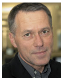
Roland Kauffmann

Seit dem 18. September 2005 gibt es in der epd-Zentralredaktion keine Aufteilung mehr in den Ressorts. An ihre Stelle sind Kompetenzteams getreten, und alle arbeiten in einem Raum, sozusagen „auf Zuruf“.