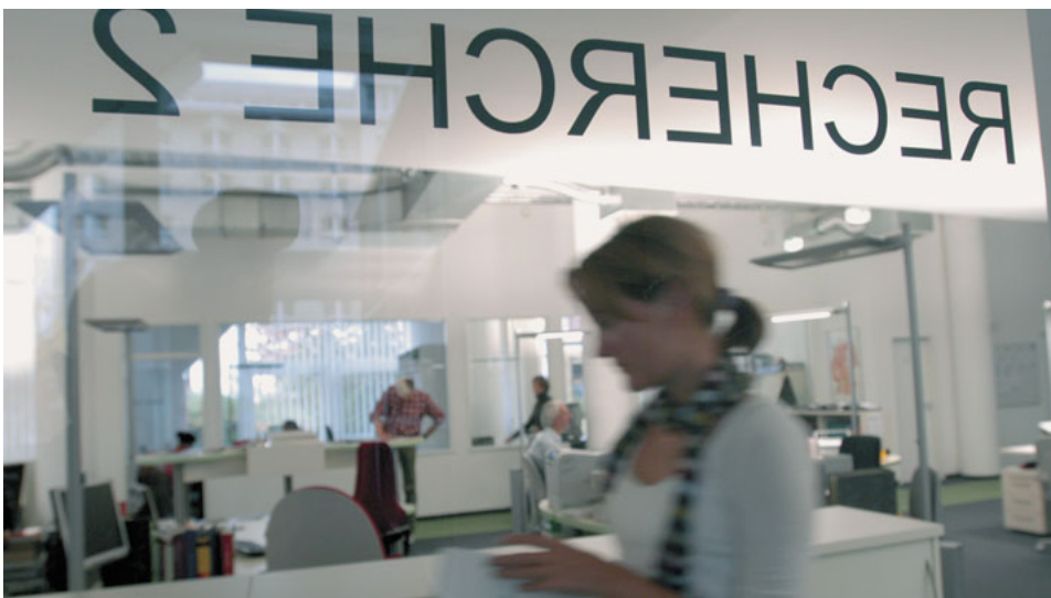
Nach dem Einzug am 19. September: der neue epd-Newsroom